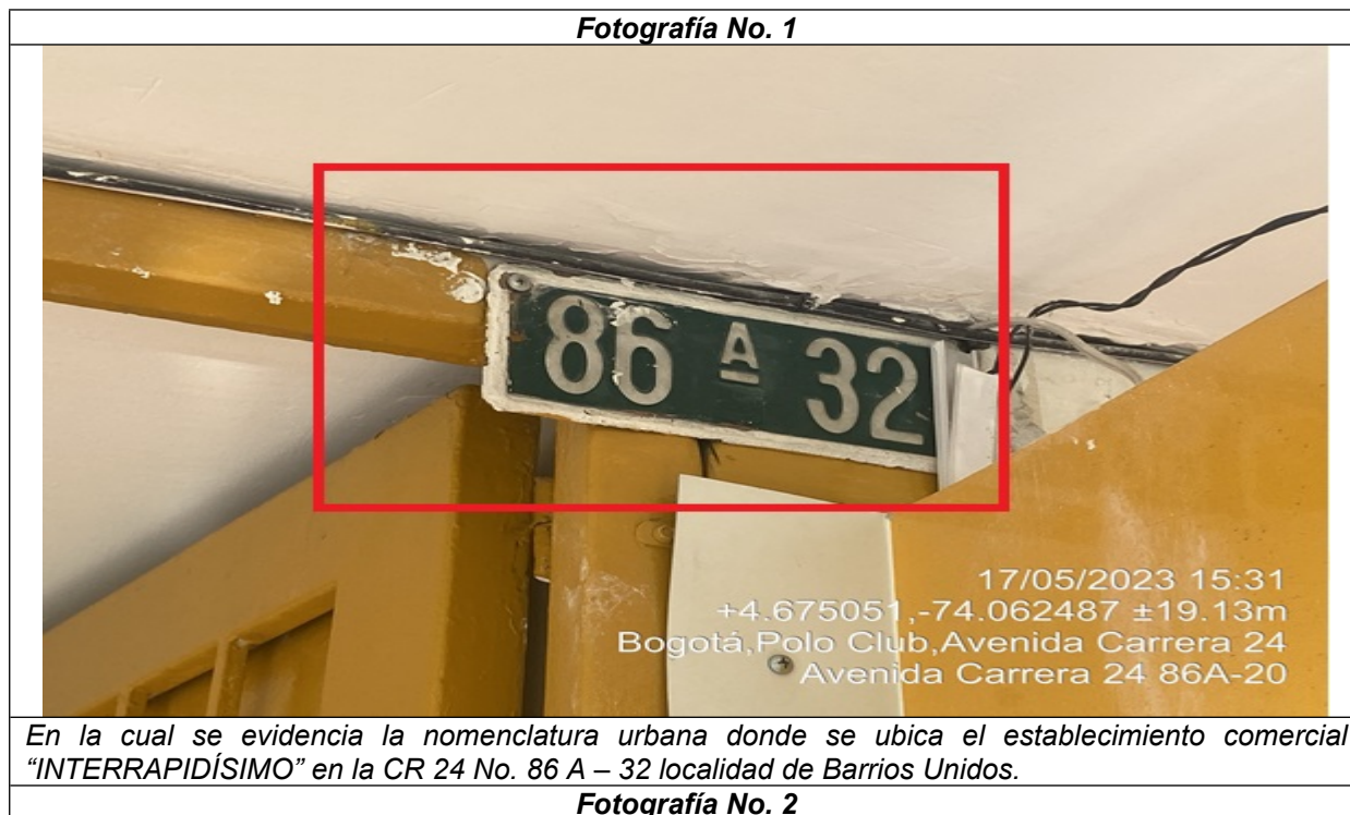
Fotografía No. 1

En la cual se evidencia la nomenclatura urbana donde se ubica el establecimiento comercial “INTERRAPIDÍSIMO” en la CR 24 No. 86 A – 32 localidad de Barrios Unidos.